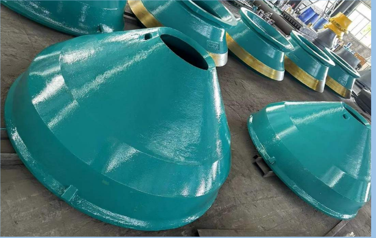
KIRICI YEDEK PARÇA;